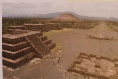
Obr. 47. Dodnes se zachovaly četné aztécké stavební památky - zbytky rozsáhlých měst a chrámů (pyramida Slunce).