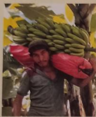
Obr. 49. Sklizeň banánů zůstává převážně ruční prací.