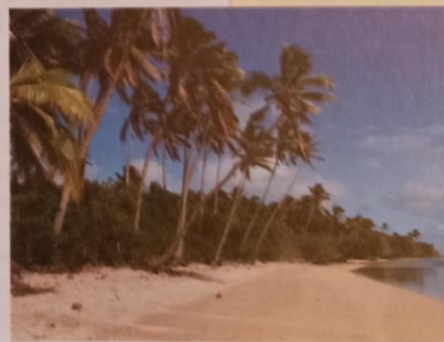
Obr. 51. Slunné pláže a celoročně teplé podnebí lákají na karibské ostrovy turisty z celého světa.

• Některé prvky vúdú jsou vitanou rekvizitou řady amerických hororových filmů. Vúdú je redukováno na (silně zveličenou) černou magii. Proto se při výkladu raději vyhněte pokusušství přepravě záklím některý (pro ně jsou velmi atraktivní) z filmových příběhů.