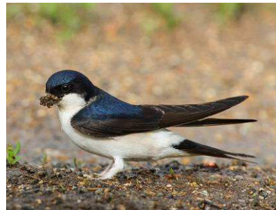
jiříčka obecná (mělce vykrojený ocas)