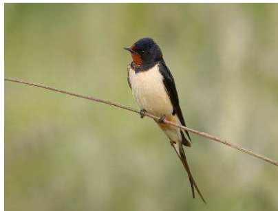
vlaštovka obecná (hluboce vykrojený ocas)