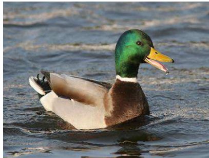
kachna divoká - samec