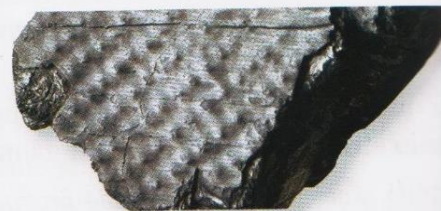
otisk kapradiny v černém uhlí