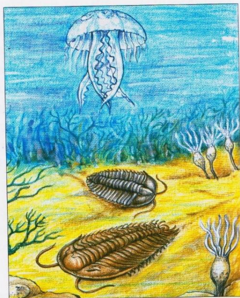
život v mořích ve starších prvohorách

Možnou příčinou hynutí organizmů v době před asi 250 miliony let byl dopad meteoritu na území dnešní Antarktidy. Do atmosféry se dostalo velké množství prachu, který na několik století zastínil sluneční záření. To vedlo k přerušení fotosyntézy a hynutí zelených rostlin.