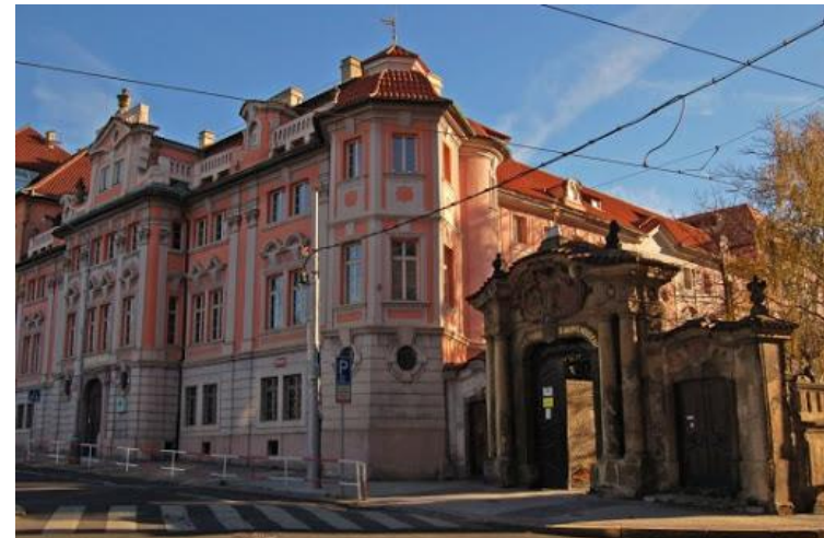
Faustův dům v Praze