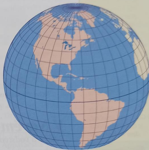
Mapa 1. Amerika v zeměpisné síti

• Zdůrazněte, že Střední Amerika je součástí Severní Ameriky. • Dělení Ameriky podle přírodních a jazykových znaků nelze kombinovat. V televizi a novinách často používané dělení na Severní a Latinskou Ameriku je chybné! • Území Anglosaské Ameriky zahrnuje také pozůstatek historické Frankofonní Ameriky (Kanada - Québec, Montréal), v USA zase výrazně vzrůstá podíl španělsky hovořícího obyvatelstva (přistěhovalci z Latinské Ameriky).