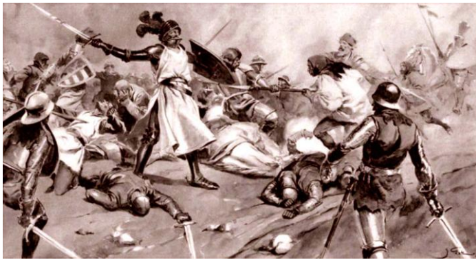
Jan Lucemburský v bitvě u Kreščaku

Janova žena - Eliška Přemyslovna. Syn Václav získal jméno Karel.